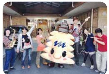
ビハーラ十条バザーフェスティバルにみなサポ出張

元々は「シンボルマーク」として生まれたみなサポですが、昨年1月、さらに活動を進めるべく、身長約70センチの“ミニ”みなサポが登場!! シンボルマークそのままの愛らしさで、活躍してくれ、保育園の寸劇でも大人気でした。そして、昨年11月、とうとう待ちに待った等身大みなサポが出現。その大きさでも変わらない笑顔と、コミカルな動きで、いろいろな催しに参加。広い世代の方々から愛され、声をかけてもらっています。みなさん、みなサポにぜひ一度会いにきてください。