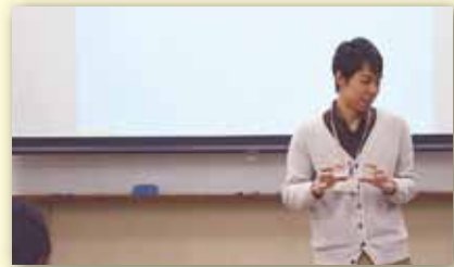
洛陽工業高校にて