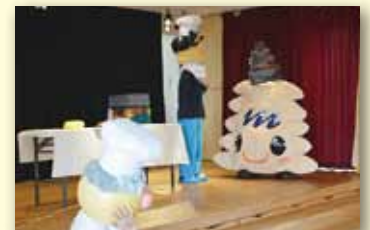
久世西保育園にて