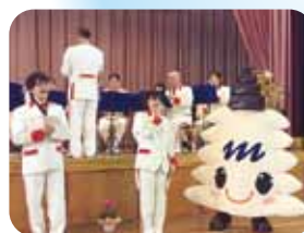
京都市消防音楽隊とコラボ