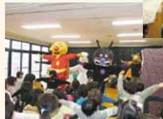
アンパンマン体操