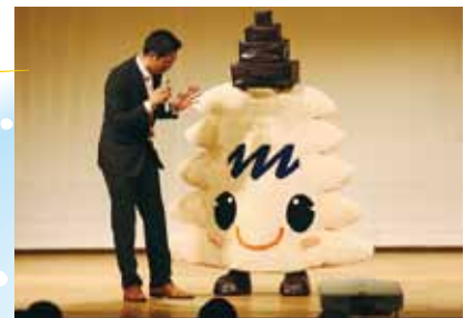
シンポジウムでの初舞台